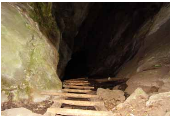
Вход в пещеру Кирилловская.

Для её прохождения необходимы две верёвки - 15м и 40м. Первая на входе в пещеру для подстраховки по деревянной лестнице (крепится за бревно перед входом), вторая для подъёма и спуска в Музыкальный грот (при подъёме за шлямбурный крюк на левой стенке или за сталактит, при спуске за выступающий массив слева по ходу). Подъём в Музыкальный грот по восходящей катушке 15м. Для подъёма можно воспользоваться фифами, однако в последние годы пещера сильно подтаяла и при хорошей подготовке первого участника ледовое снаряжение не обязательно. Грот потрясает своим эхом, а в небольших ходах глухим звучанием. Прямой ход ведёт в «тараканы бега» - узкие ходики, где сохранилось достаточное количество уголков с красивыми натечками.